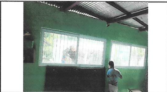
Instalación de ventanas de pvc