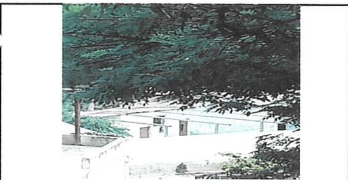
Instalacion de estructura portante y lámina