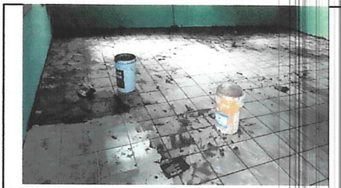
Colocacion de piso cerámico