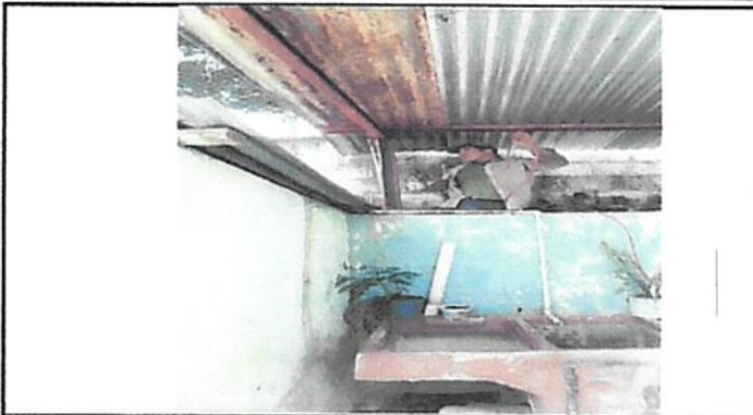
Reparacion de techo