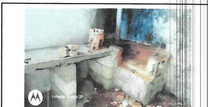
Fabricacion de estufa rural Lorena

Observación: Si es necesario se pueden agregar hojas adicionales y actualizar el número de hojas.